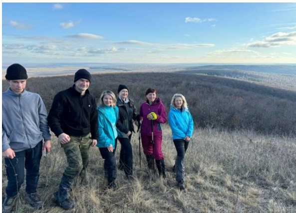
Рис. 20. Вид с Поповой шишки.