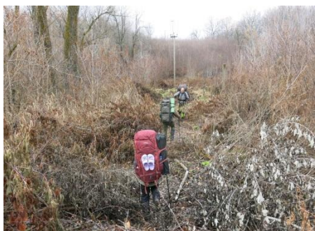
Рис. 3 Лесной овраг.