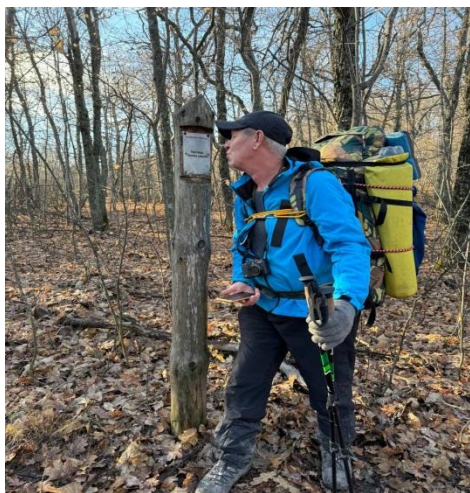
Рис. 18. Указатель на Попову шишку.

Подъём дежурных в 5:00, все по графику. Завтракаем овсяной кашей и начинаем сборы. Отзваниваемся в три отделения МЧС и в 8:15 выходим на маршрут. Заходим в лес и начинаем затяжной подъем на шихан Попова шишка. В лесу очень тихо и красиво. В 10:55 доходим до Поповой шишки. С ее вершины открывается невероятно красивый вид. Мы устраиваем фотосессию и в приподнятом настроении продолжаем путь.