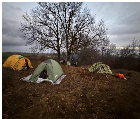
Рис. 7. Лагерь у Свиного ключа..