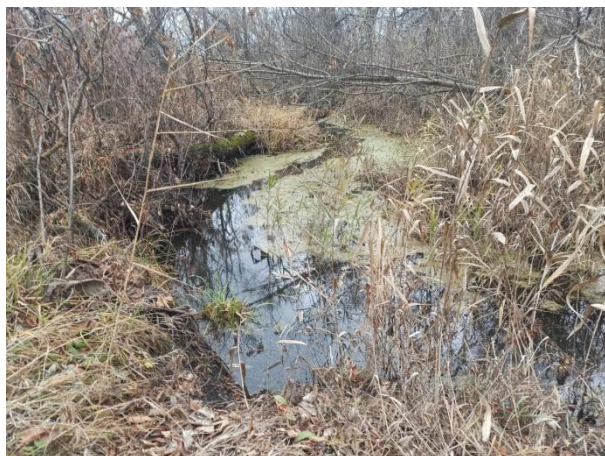
Рис. 30. Река. Терса.

В 16:45 доходим до парковка в районе лыжной базы БРТ. Маршрут пройден. Мы много смеемся, делимся впечатлениями о походе. Через 10 минут за нами, по договоренности, приезжает микроавтобус и развозит нас по домам. Руководитель отзванивается о завершении маршрута.