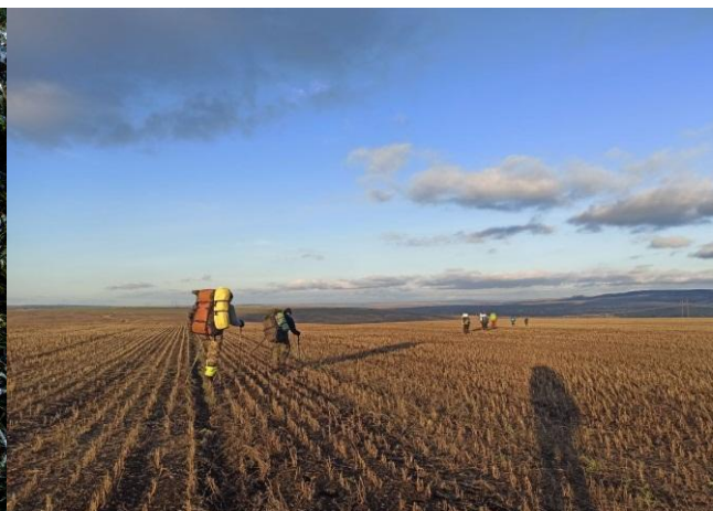
Рисунок 15. Поле.