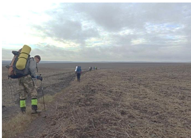
Рис. 26. Бескрайние поля.

В 17:35 останавливаемся на ночлег рядом с рекой Терса, в районе села Заветное. Отзваниваемся в МЧС. На ужин картофельное пюре из пакета и тушенка. Понимая, что это крайняя ночевка в походе, не хочется расходиться. Хочется подольше посидеть у костра, пообщаться. Спать расходимся в 21:38.