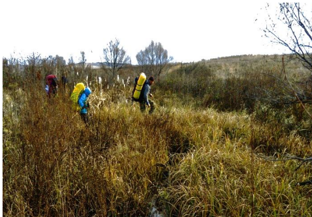
Рис. 28. Переправа через р. Терса.