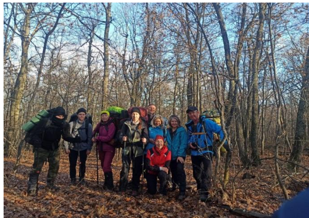
Рис. 21. Команда у подножья Поповой шишки

Дальше шли по лесу на спуск, затем вышли в поля. В 13:05 остановились на обед у озера в районе села Аппалиха. Пообедали горячей кружкой с карбонадом и чаем с конфетами и в 13:55 отправились по маршруту.