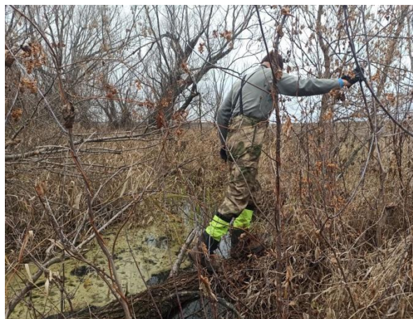
Рис. 31. Переправа через р. Терса.