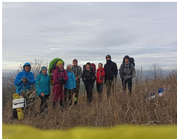
Рис. 23 Команда на вершине троической горы.

Спустились лесом, видели лису. Несколько минут решали, как лучше пройти, но наш ответственный за навигацию указал путь. Потом шли полями и 17:58 встали на ночлег в районе села Демкино. В 19:20 был готов горячий ужин, в 21:00 отбой. От усталости забыли отзвониться в МЧС, но и про нас все забыли. Одна из причин была в том, что мы оказались в Хвалынском районе, а вторая в том, что была плохая сотовая связь.