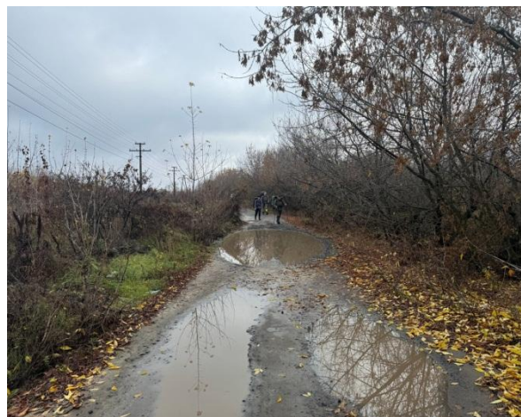
Рис. 2. Начало пути.

В 10:35 взяли штурмом лесной заросший овраг, пересекли железную дорогу, часть пути прошли по еле проходимым зарослям. Не доходя до деревни Девичьи горки, мы повернули в сторону трассы. В 13:10 остановились на обед в живописных посадках. Все вокруг было в опавших листьях, которые шуршали под ногами. Из-за короткого светового дня, обед было решено не готовить. Он состоял из колбасы, сухарей, сладостей и чая из термоса. Правда нас ждал сюрприз - один из участников-новичков взял с собой и угостил всю команду настоящей шарлоткой! Было очень неожиданно и приятно и мы в отличном настроении после обеда отправились в путь.