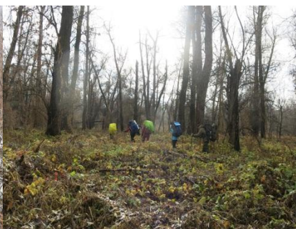
Рис. 4. Труднопроходимый лес.