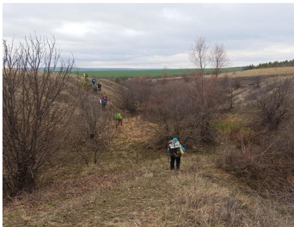
Рис. 6. Овраг на пути к Свиному ключу.

Встали на ночевку у Свиного ключа в 17:35. Разбили лагерь, отзвонились в три отделения МЧС. Около 19 часов был готов горячий ужин – гречка с тушенкой. В 21:00 отбой.