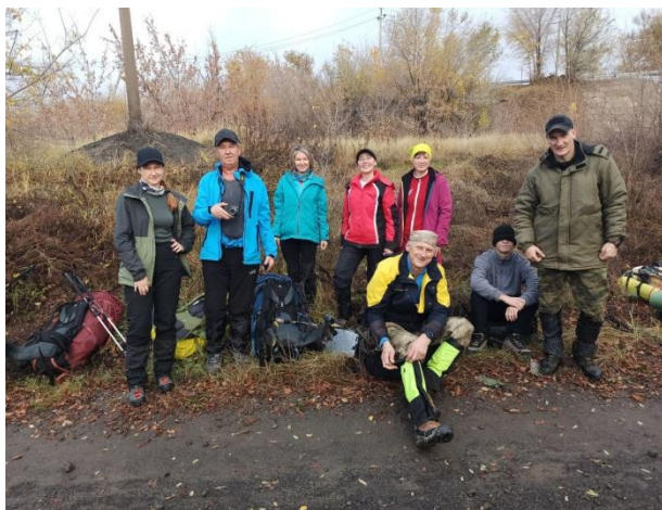
Рис. 1. Первый привал.

Утром первого ноября в 8:00 мы встретились на остановке у Саратовской ГЭС, разобрали продукты и общественное снаряжение и в 8:55 отправились по маршруту. Мы перешли ГЭС, было пасмурно, но довольно тепло. Когда мы смотрели прогноз, в этот день обещали дождь, но в последний день прогноз изменился и мы были очень рады этому, настроение было приподнятое. Первый привал сделали через 30 минут движения, когда спустились ближе к Волге по проселочной тропе, окруженной деревьями. В дальнейшем шли по 45 минут и отдыхали 15 минут. Тропа, по которой мы шли, была вся в грязи и больших лужах, которые приходилось обходить.