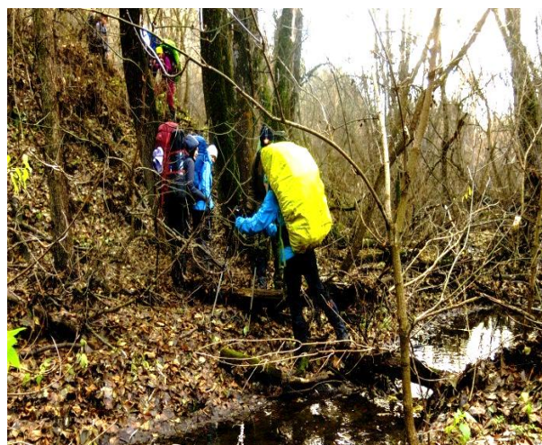
Рис. 13. Брод через Свиной ключ..