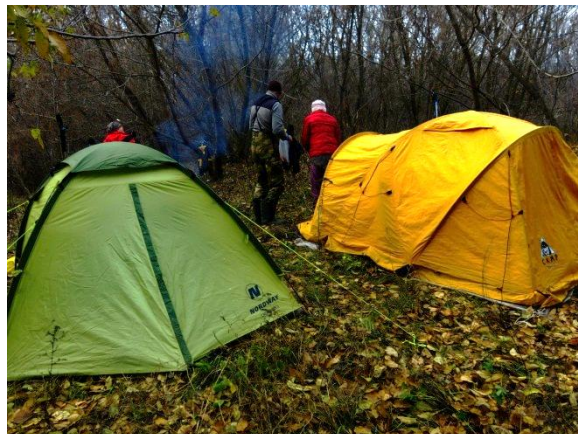
Рис. 29 Лагерь на р. Терса