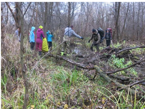
Рис. 8. Брод на Свином ключе