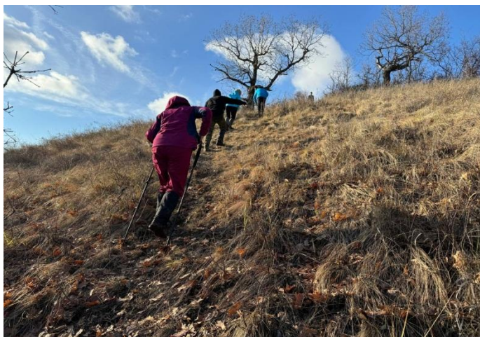
Рис. 19. Подъем на Попову шишку.