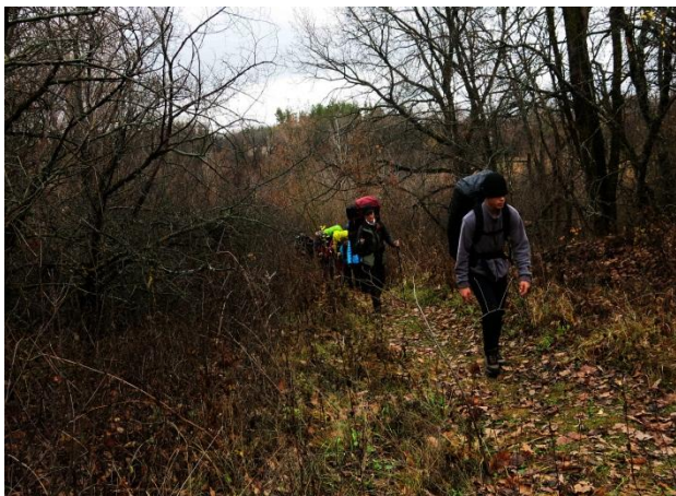
Рис. 22. Подъем на Троицкую гору.

Нас ждала Троицкая гора в лесу Армейские горки. Подъем дался не просто, мы были уже уставшими, но в 15:27 мы были на вершине.