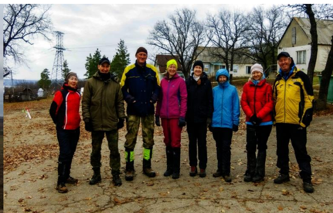
Рис. 32. Поля в районе с. Широкий Буерак. Рис. 33. Завершение маршрута. Район базы БРТ.