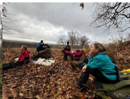
Рис. 5. Обед.

Мы шли вдоль реки Терса по тропам, в направлении места нашей первой ночевки. В 15:37 на пути увидели глубокий овраг, заросший сухой травой и кустарником. С рюкзаками, особенно новичкам, было не просто пройти через него, но мы все справились!