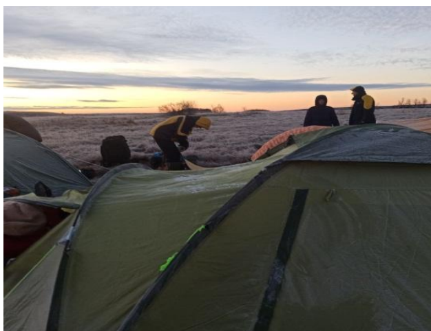
Рис. 12. Лагерь утром третьего дня.

В 8:35 мы в брод перешли Свиной ключ и улубились в тепловский лес. Местами было сложно идти, деревья и кусты цеплялись за рюкзаки, но потом мы вышли на хорошую просеку в лесу, которая шла на затяжной подъем, затем на спуск. Выйдя из леса нашему взору представились обширные поля. Одни были засажены озимами, другие были распаханы или просто отдыхали. Выглянуло солнце, небо прояснилось. Это было очень красиво!