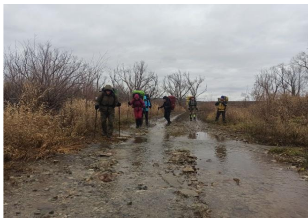
Рис. 27. Переправа через р. Терса.