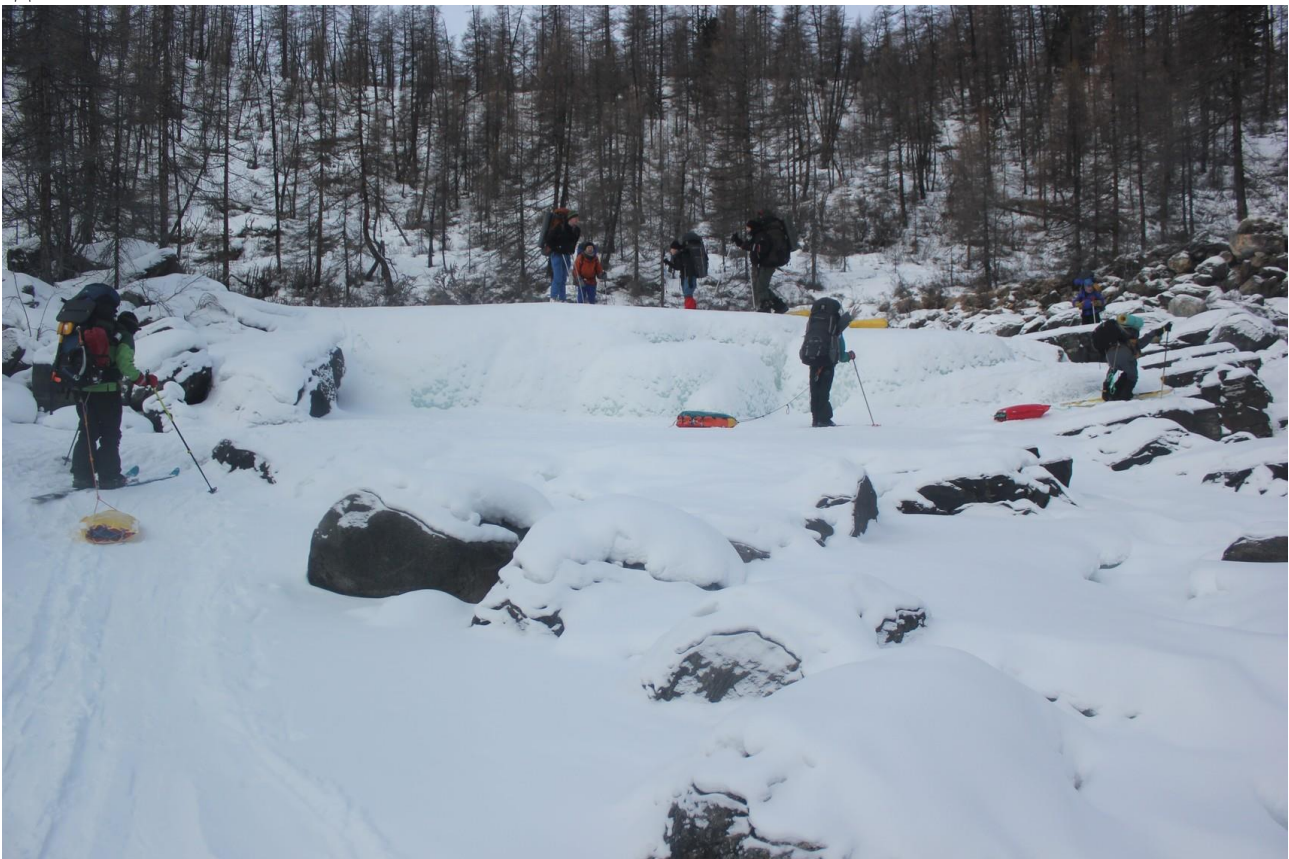
Ступеньки на реке Ара-Хонголддой

6:00 подъём дежурного, в 6:30 подъем группы. Температура -15. В 8:30 выход группы. Снега на реке нет, наледь крутая и мокрая, поэтому сразу идем в кошках. Примерно через переход русло реки покрыто снегом, надеваем лыжи. Русло становится круче, периодически поднимаемся на ступеньки высотой до полуметра. Ближе к границе зоны леса русло становится более пологим, наледи заканчиваются. Идем на лыжах, снега примерно по щиколотку. Через 4 перехода в 12:25 обедаем. Вода из промоин, дрова есть. Солнечно и жарко. В 14:30 выходим с обеда и продолжаем идти вверх по долине. Русло реки значительно расширяется. В 16:40 сворачиваем в долину реки Зун-Гол. В 18:00 встаем на ночевку на ровных площадках. Дрова есть, жидкой воды нет. Впереди виднеется каньон, поэтому ночуем здесь.