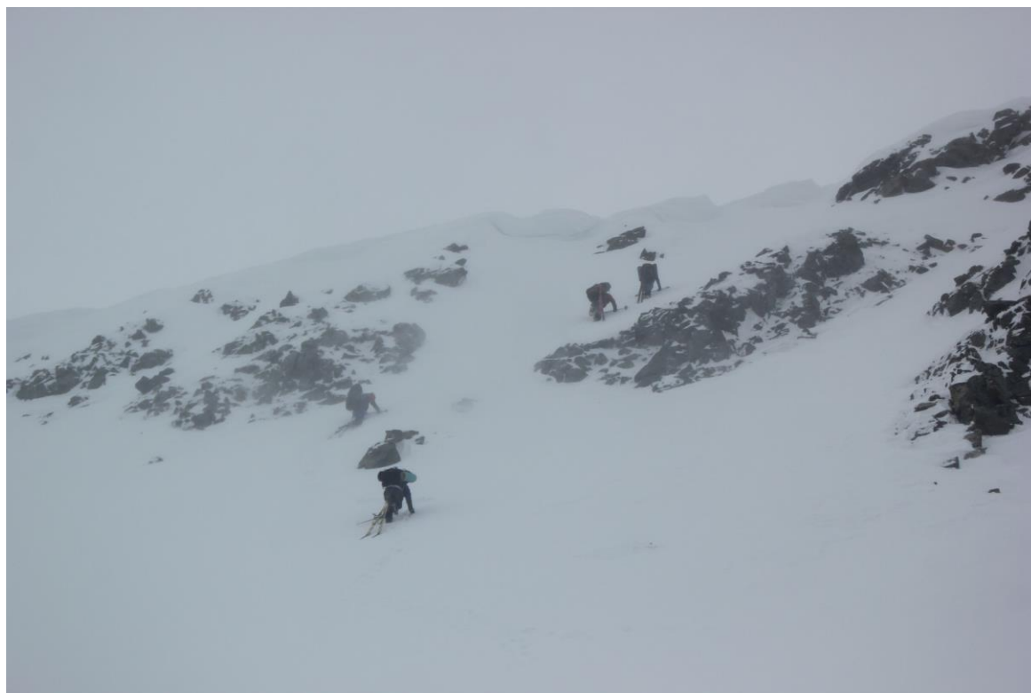
Перевальный взлет пер. Шумак

05:30 подъём дежурного. В 08:30, надев бипперы, выходим. Снег достаточно плотный, идем на камусах. Через 2 перехода непосредственно под перевальным взлетом переобуваемся в кошки, ступени бьются хорошо. На седловине карниз, поэтому забираем вправо по ходу, к камням, где карниз минимален. В 11:30 вышли на перевал. Спускаемся в кошках, затем на лыжах. Съезжаем в широкую долину Эхе-Гер. В 14:00 перекусываем и едем дальше. Перед началом крутой наледи и каньона на реке уходим на правый берег, идем пешком по летней тропе. Снега мало. В 17:30 в кошках переходим приток, поскольку представляет собой он крутую наледь. В 18:10 при первых признаках леса ставим лагерь. Дров немного, но найти можно.