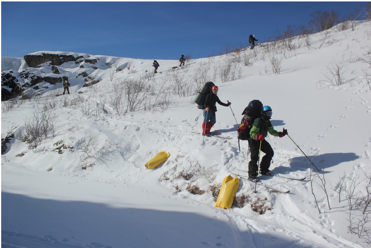
Обход каньона в верховьях Ара-Ошей