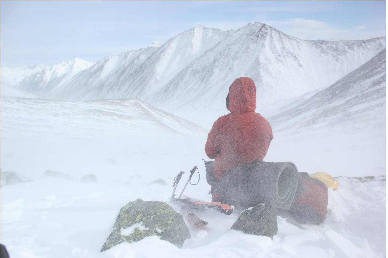
Спуск с перевала