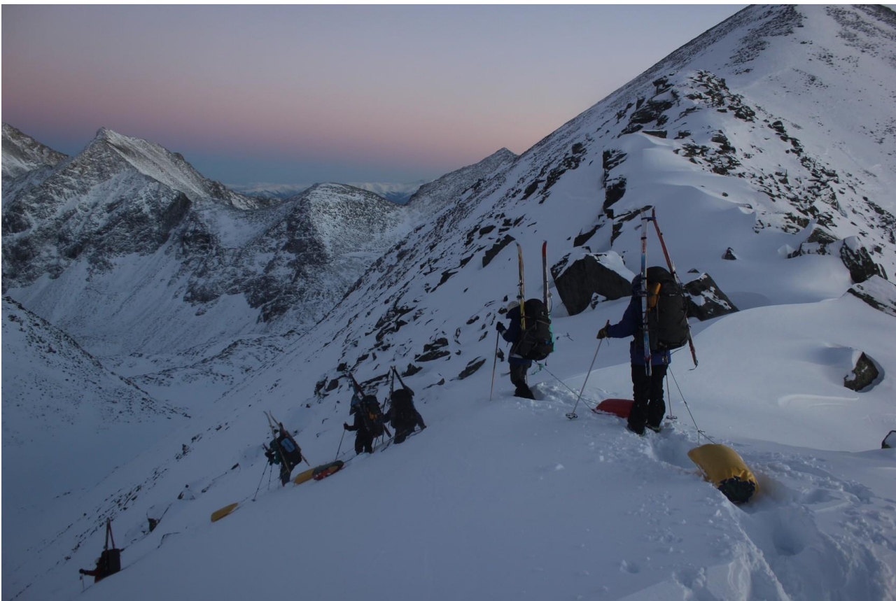
Спуск с перевала