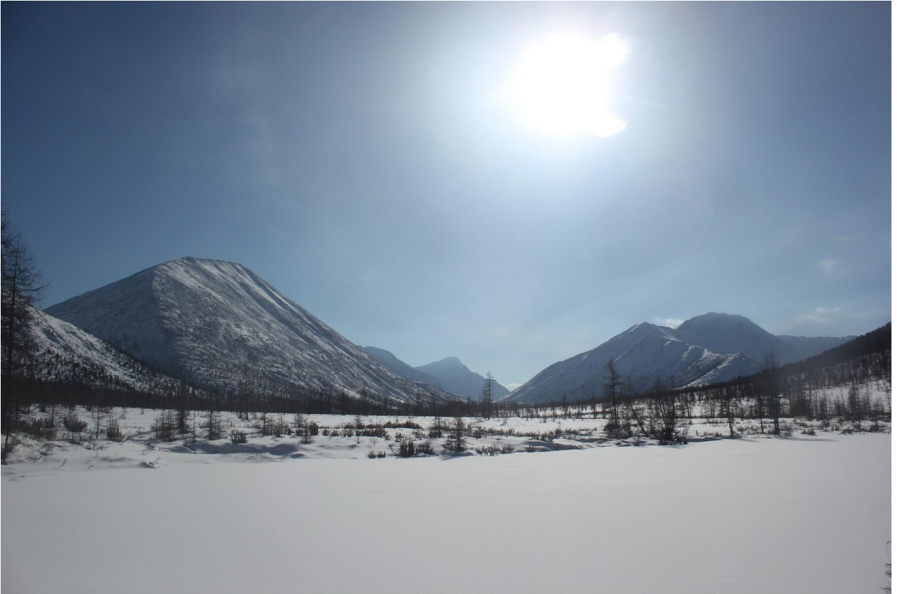
Верховья долины Ара-Хонголдой