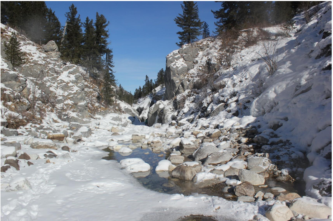
Главный каньон Ара-Ошей (открытая вода)