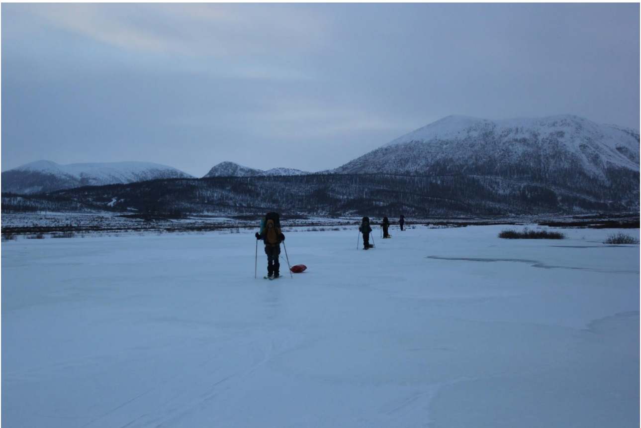
Верховья р. Китой

В 16:32 выгрузились из машины на точке старта. Сильный ветер, температура -10. В 17:35 надели лыжи и пошли по льду реки. Местами наледи. В 18:50 у ближайших дров поставили лагерь на правом берегу реки. Вода изо льда. Дрова с левого берега реки. Ловит Мегафон и МТС.