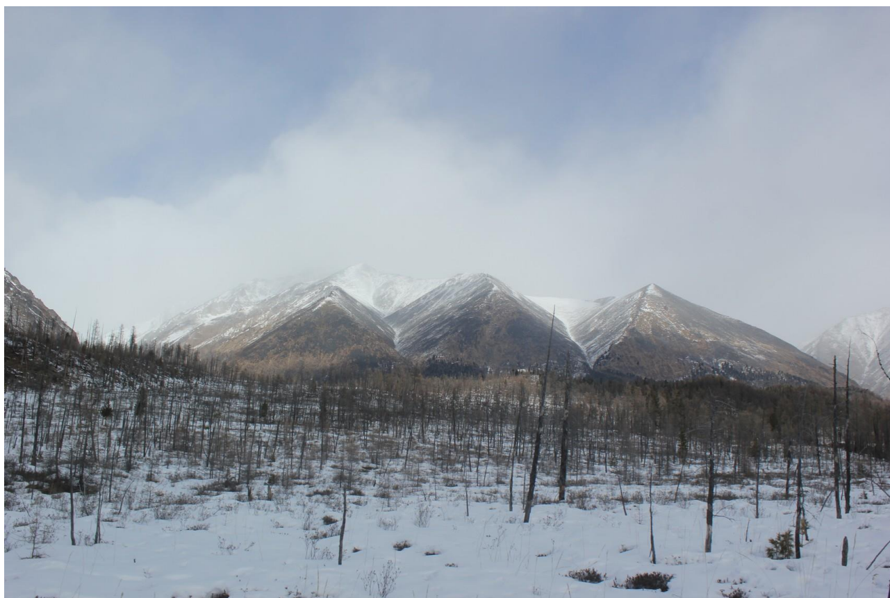
Налево – Хубуты, направо - Шумак

07:00 подъем дежурного. В 09:40 выходим, идем по тропе, то пешком, то на лыжах. В густом лесу, где снега мало, тропа теряется. В какой-то момент сворачиваем с основной тропы на более натоптанную охотничью, сбиваемся с пути и оказываемся в горелом лиственничнике. Подсекаем тропу уже ниже Хубутинской развилки, перед тем, как идти по ней дальше обедаем. В 16:15 продолжаем спуск, тропа большая, то едем, то идем пешком. Спуск практически заканчивается, тропа становится дорогой. В 19:00 ставим лагерь у дороги. Дрова есть.