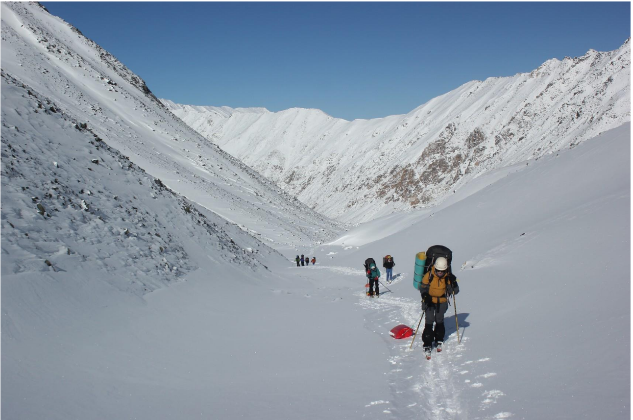
Русло реки под перевалом Самарский