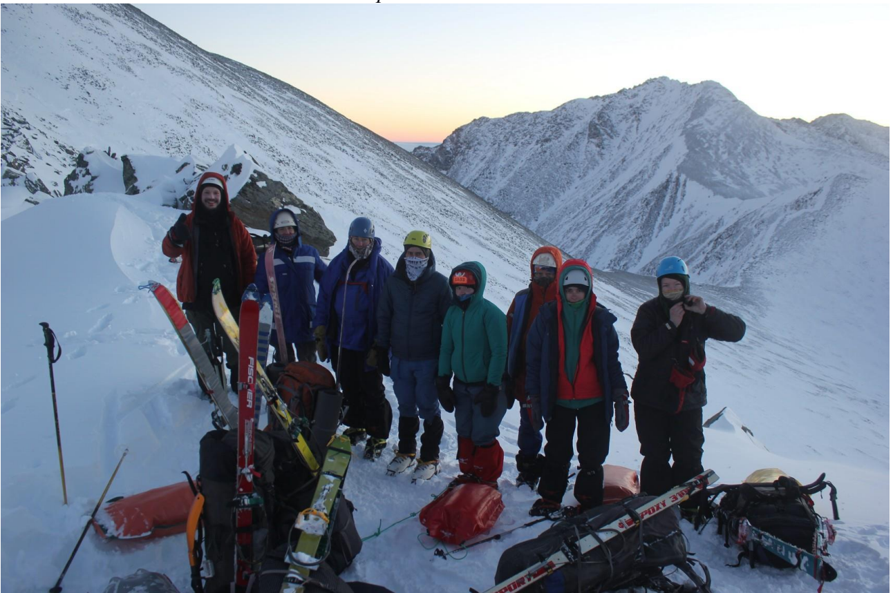
Группа на перевале Самарский