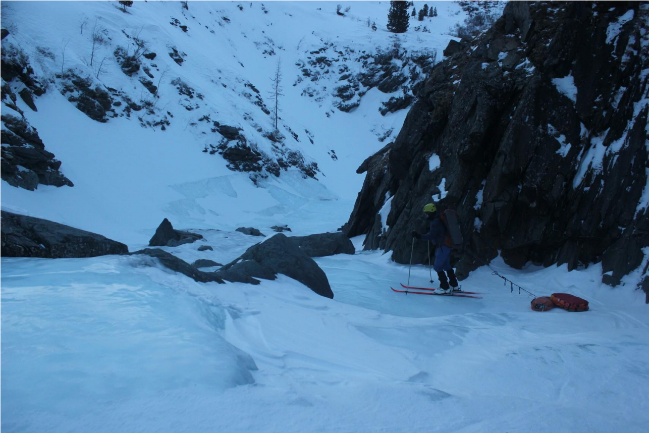
Р. Правый Шумак