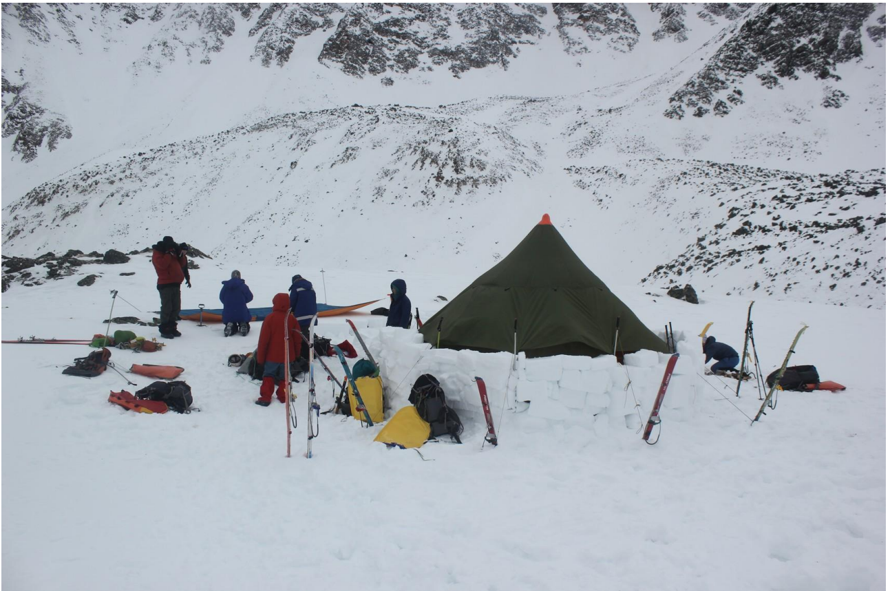
Лагерь под пер. Шумак