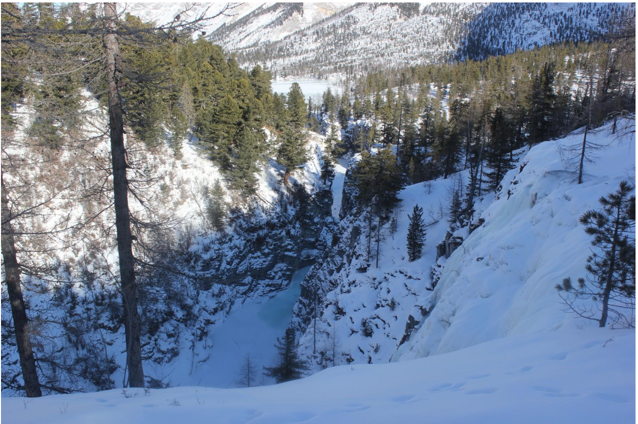
Обход участков открытой воды