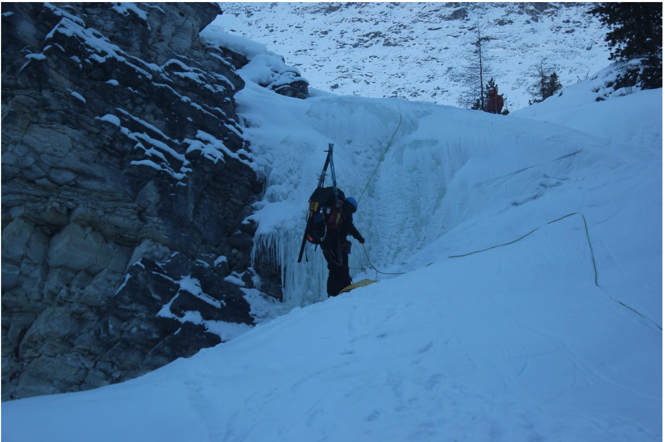
Спуск в каньон