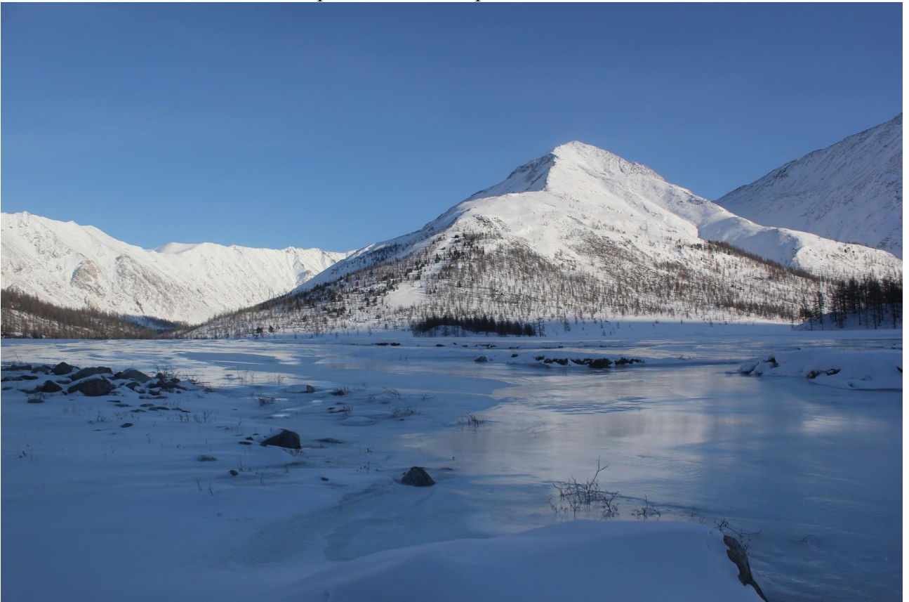
Стрелка рек Ара-Хонголдой и Зун-Гол