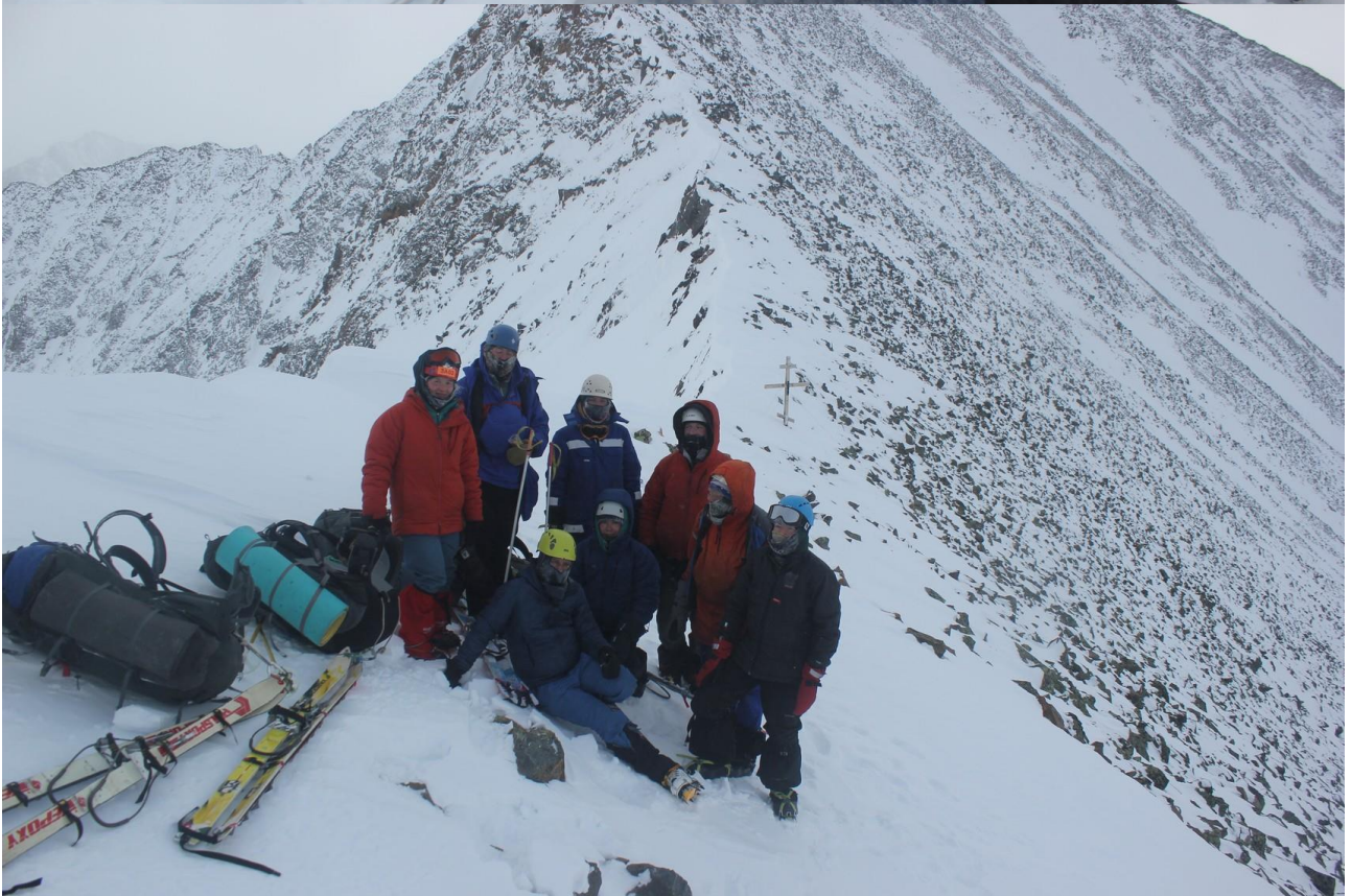
Група на пер. Шумак