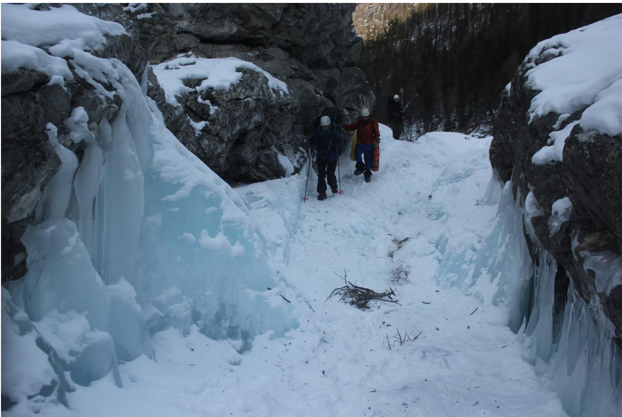
Пороги в каньоне