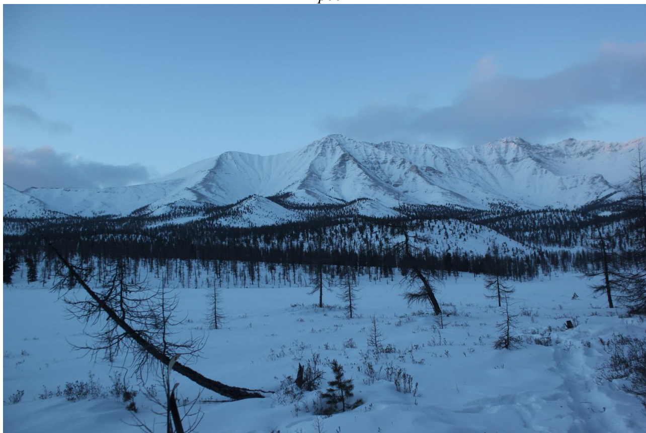
Вид с места ночевки под пер. Дабан-Жалга