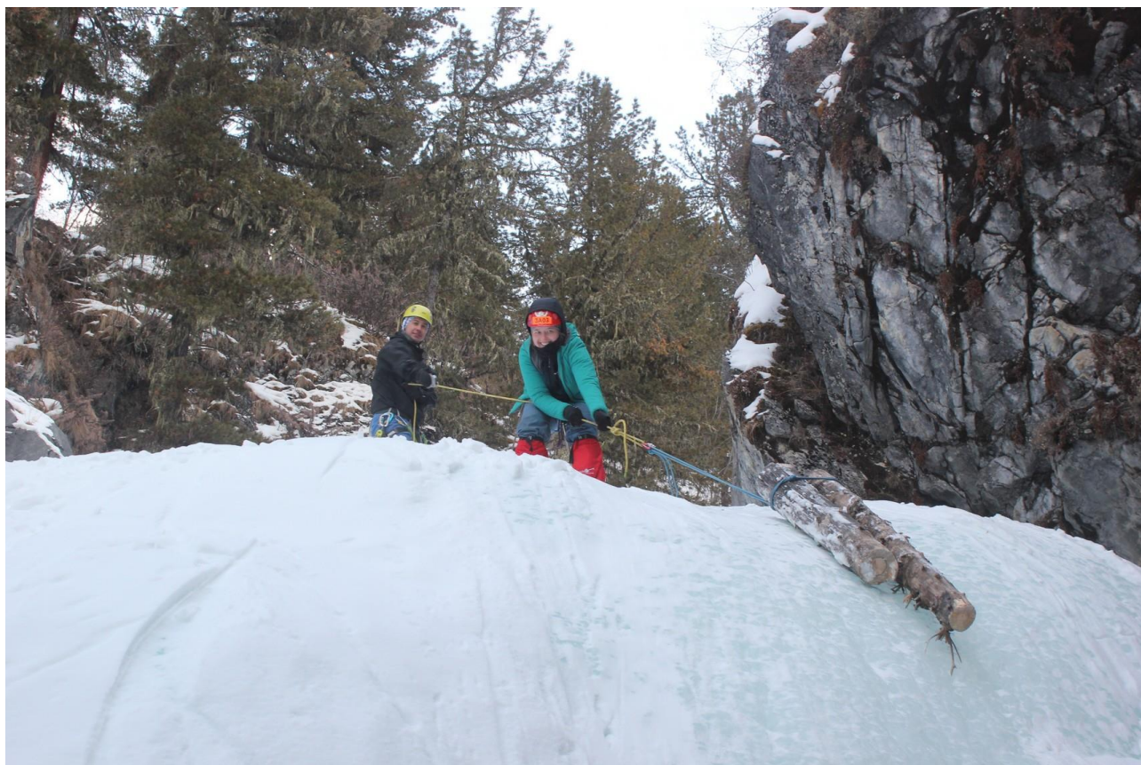
Прохождение каньона Зун-Гол