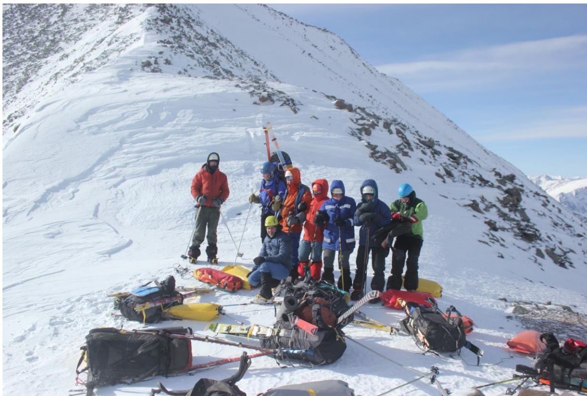
Группа на перевале Горных Духов

05:30 подъём дежурного. Ясно, но ветрено, -15. Выходим в 07:50. Идем чуть весее вчерашнего, но все рано не очень. Первый привал под перевальным взлетом перевала Горных духов. Далее в лыжах, а затем в кошках поднимаемся на седловину. Снега достаточно много, там, где слишком круто, чтобы идти в лыжах – глубоко проваливаешься. В 10:50 выходим на седловину, дожидаемся отстающих, забираем у некоторых рюкзаки. В 11:30 начинаем спуск. Первая часть, наиболее крутая, с камнями дается тяжело из-за ветра. Дальше проще, снег становится глубже. Спуск затягивается надолго из-за отсутствия горной техники у половины группы и сильного ветра, мешающего передвигаться. Отъехав немного из-под перевала на лыжах, перекусываем, и продолжаем спуск в долину Правого Шумака. Сначала на лыжах, затем, когда каньон становится круче и начинается открытый лед – в кошках. В 19:30 ставим лагерь на левом берегу. Дров хватает, жидкой воды нет. Принимаю решение не идти перевал Эдельвейс, а выходить из района через перевал Шумак: на спуске с перевала Эдельвейс первая часть группы убилась бы, потому что не умеет ходить по камням, а вторая часть – замерзла бы, пока ждала первую. Sad but true.