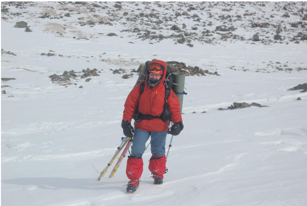
Спуск с перевала