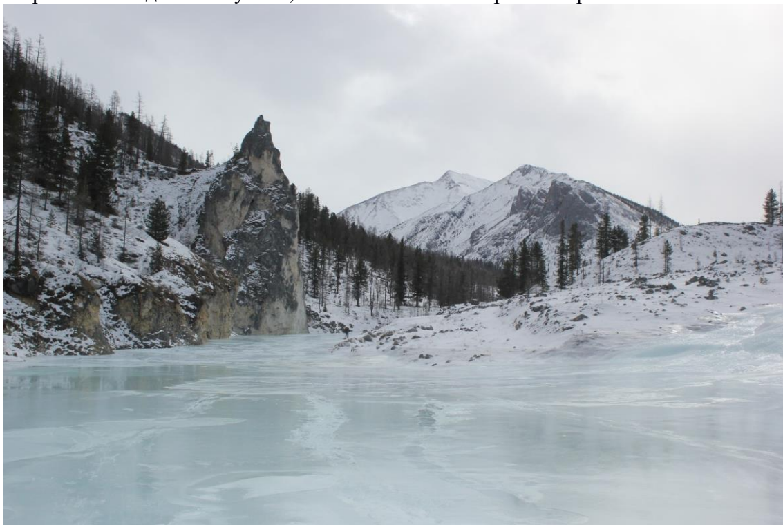
Стрелка рек Архат и Зун-Гол

06:00 подъём дежурного. Теплее обычного - -10. В 08:30 вышли и пошли вверх по Ара-Ошею. Река в каньоне, много рваного льда, периодически приходится вылезать на ступеньки. На стрелке рек Ара-Ошей и Архат уходим в левую по ходу долину, начинаются мокрые наледи, почти все время идем в кошках. Через 4 перехода в 13:30 обедаем на стрелке рек Архат и Зун-Гол. Дрова из плавника, которого тут много, вода из полыньи. В 15:30 продолжаем движение и сворачиваем в каньон Зун-Гол. Через переход подошли к Зун-Гольской яме, в 16:45 начали подъем на первую ступень водопада. Первая ступень мокрая, наверху лед вперемешку с водой, сделать станцию получается не сразу. Поскольку ночевать планируем сразу над третьей ступенью, а с дровами там могут быть проблемы, пока группа поднимается на первую ступень и затаскивает вещи, а часть группы провешивает вторую ступень – свободные граждане пилят лежащий в каньоне плавник и подтаскивают его под вторую ступень. Вторая ступень сухая, короткая и присыпанная снегом. Третья ступень проходится лазанием в кошках, вещи передаем. В 19:00 ставим лагерь сразу над третьей ступенью на правом по ходу берегу. Вода из мокрой наледи чуть выше по каньону. Дров полно, а мы со своими пришли. Странно. В 2018 году здесь дров не было. Темп движения не радует. Вызывает сомнения как возможность успеть провести полдня на Шумаке, так и возможность пройти перевал Соанский.