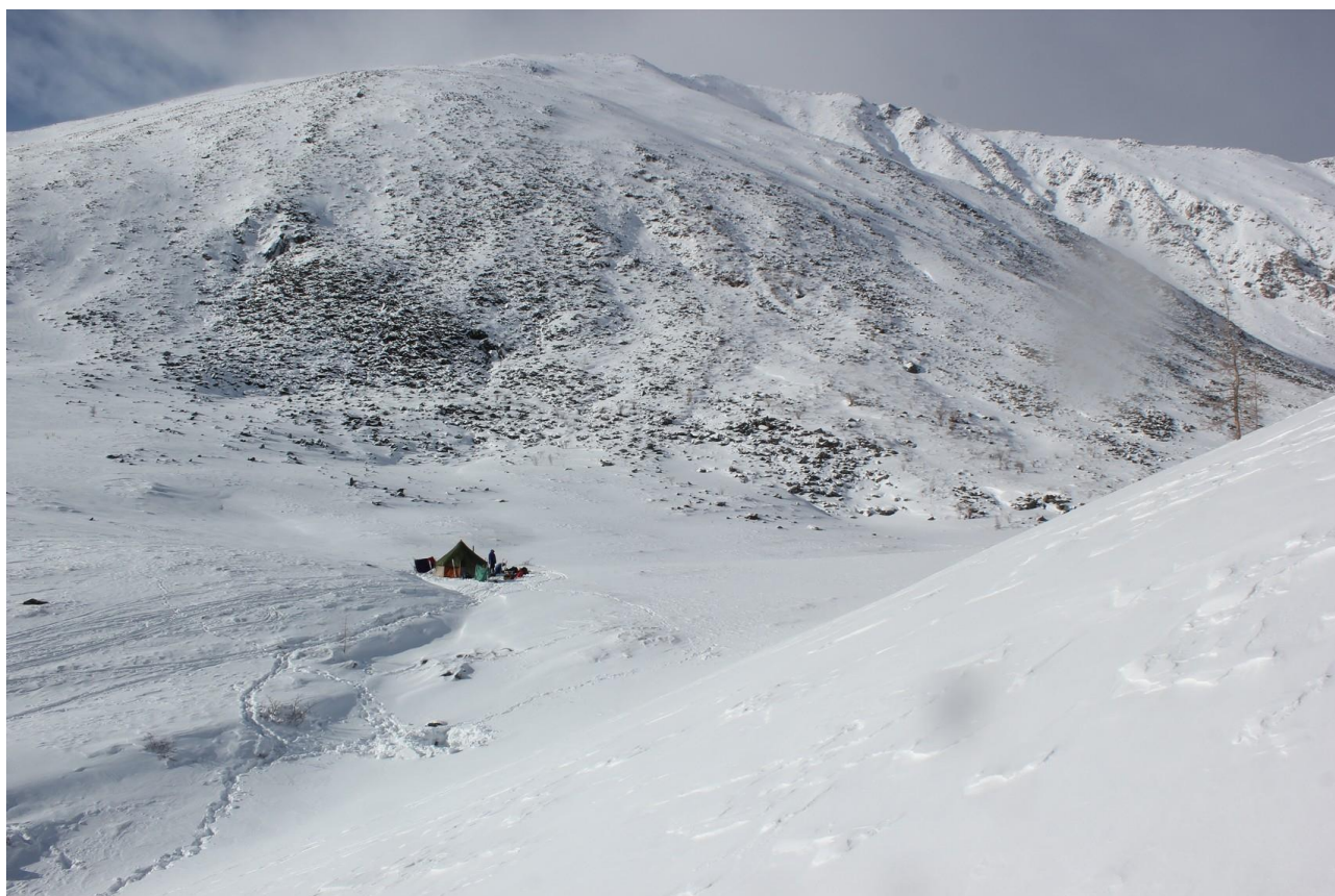
Лагерь под пер. Горных Духов

За ночь выпал снег. Встали поздно, температура -10. Вышли только в 09:40. Идем в кошках, довольно скоро начинается глубокий снег, переобуваемся в лыжи. Начинаем вылезать из каньона на левый по ходу борт по крутому, поросшему лиственницами, борту. Погода портится, начинается поземка, видимость ухудшается. В 11:40 вышли в широкую ровную долину над каньоном, выше ГЗЛ. Погода лучше не становится, до перевала далеко, группа после вчерашнего идет вяло, поэтому принимаем решение устроить полудневку. Пока группа ставит лагерь и строит стенку, часть народу налегке спускается в лес за дровами. После обеда мимо нас проходит группа из 3-х белорусов на снегоступах. Общаемся некоторое время, они уходят ночевать чуть выше, а дальше собираются идти на Шумаки и в каньон «Сказки Пушкина». К вечеру видимость улучшилась, но ночью начался сильный порывистый ветер. Потеряли день, маршрут совершенно точно придется сокращать.